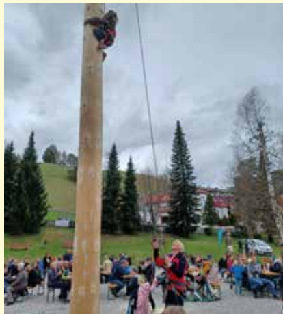
Die Bergrettung unterstützte die Nachwuchskletterer