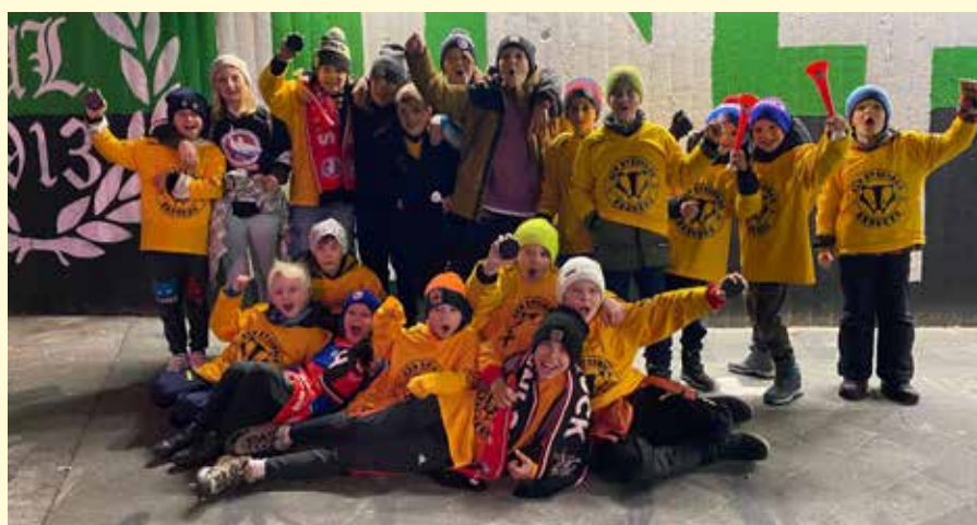
Ausflug Tiwag Arena Innsbruck - Spiel der Haie Innsbruck

spiel gegen eine Nachwuchsmannschaft aus dem Stubai kam richtiges Derbyfieber auf, die Zuschauer des Spiels füllten Halle und Vereinslokal mit Leben. Auch das Faschingsgshnas am Faschingsdienstag hatte regen Zulauf. Für alle Maskierten spendierte der EEV Faschingskräpfen und Getränke.