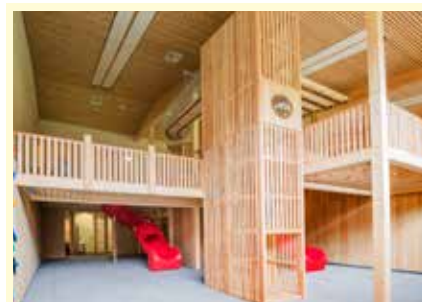
Die Erlebnisspielwelt im JUFA Hotel Wipptal begeistert das junge Publikum aus Nah und Fern