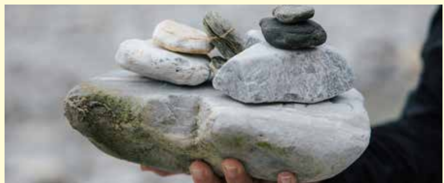
Sich seiner Stressfaktoren bewusst machen.

An den neuen Programmen unter dem Qualitätsversprechen gesunde.region wurde mit unseren lokalen Stakeholdern in drei Arbeitsgruppen getüftelt, recherchiert und kalkuliert. Herausgekommen sind interessante neue Angebote. Ein Thema von vielen, die uns momentan bewegen, ist z.B. die Stressbewältigung. Dabei erfahren die Teilnehmer zunächst in der Theorie und dann in der Praxis von Stressoren und davon, wie man diese abbauen kann. Passend dazu gibt es etwa eine Yoga-Einheit, Tipps von DiätologInnen, wie man sich regional, saisonal und gesund ernähren kann und natürlich viel Natur, um weitere Schritte auf dem Weg zu sich selbst zu tätigen.