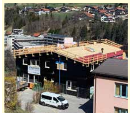
Neben der Musikschule entsteht das neue Eltern-Kind-Zentrum Wipptal

Dach. Wir bündeln und verbinden (soziale) Dienstleistungen - im Grunde das Leben miteinander. Dies stellt eine wichtige Ergänzung zum bestehenden Angebot dar.