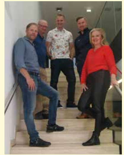
Ausschuss Vereine und Sport, Familie und Jugend: