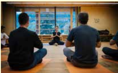
Yoga-Einheit im Almi's Berghotel

Bewegung aus eigener Kraft in unserer noch ursprünglichen Natur, gesunde Ernährung und Entspannung - das sind die drei Kernfelder, die einen gesunden Urlaub aber auch ein gesundes Leben im Wipptal ausmachen. Mit speziellen Angeboten, die im besten Fall von Experten betreut sind, möchten wir das Gesundheitsbewusstsein nachhaltig stärken.