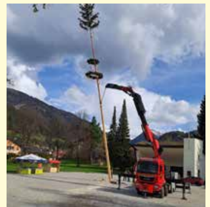
Viele Schaulustige verfolgten das Aufstellen des Maibaumes