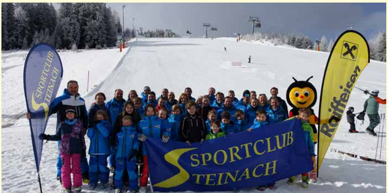
Gruppenbild SC Steinach