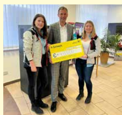
Die Raika verdoppelte den Betrag an den Sozialfond

Schließlich wurden jeweils 2000 Euro an den Wipptaler Sozialfond und an das Arche Haus in Steinach gespendet. Die Raiffeisenbank Wipptal-Stubaital Mitte verdoppelte die Spende an den Sozialfond auf 4000 Euro. Ein wichtiger Aspekt für die Jungbauern war dabei, dass die Spende in der Region bleibt, da auch der Verein durch die Einheimischen, welche die Veranstaltungen besuchen erhalten wird.