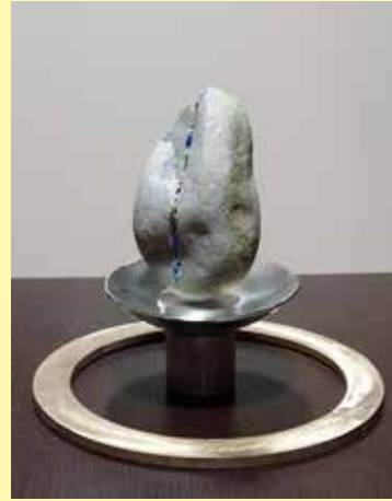
„Bach im Stein“