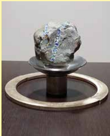
„Ecken und Kanten“