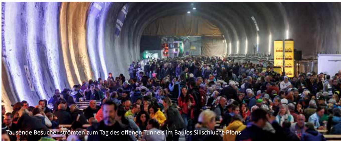
Tausende Besucher strömten zum Tag des offenen Tunnels im Baulos Sillschlucht-Pfons