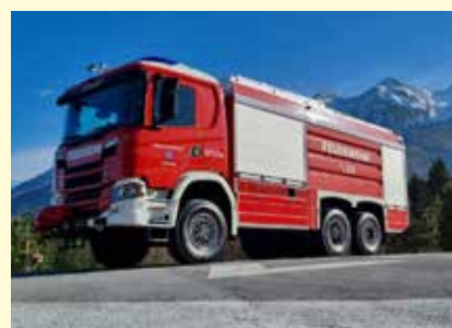
Das neue Großtanklöschfahrzeug der Freiwilligen Feuerwehr Steinach in voller Pracht

man für jeden Einsatz bestens vorbereitet ist.