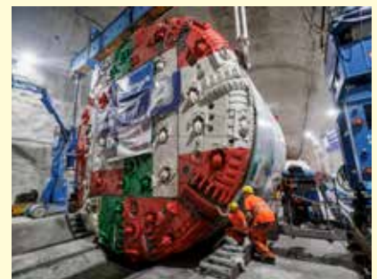
Aufbau einer der beiden Tunnelbohrmaschinen für den Vortrieb Richtung Süden

51.000 Tübbinge werden in den kommenden 2,5 Jahren gefertigt, die nahe Produktion spart 27.000 LKW-Transporte.