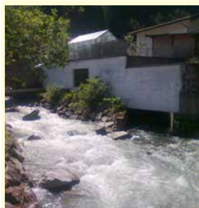
Valserbach vor der Verbauung

Die Verbauungsmaßnahmen am Valserbach und die Einmündung in die Sill wurden noch vor dem Sommer und somit vor der Hochwasserzeit abgeschlossen. Es sind noch Restarbeiten, wie beispielsweise die Errichtung der Fuß- und Radwegbrücke durchzuführen und somit ist der ganze Bereich von Stafflach hochwassersicher. Die alten desolaten Uferverbauungen konnten durch eine massive erosionssichere Grobsteinschichtung ersetzt werden und der Durchflussquerschnitt kann nun schadlos ein 100-jähriges Hochwasser aufnehmen. Durch die Errichtung des Einleitsporns im Mündungsbereich in die Sill wurde auch die hydraulische Abfuhrkapazität erhöht und das 100-jährige Hochwasser kann