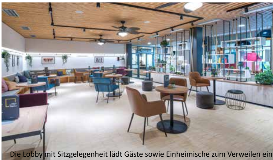
Die Lobby mit Sitzgelegenheit lädt Gäste sowie Einheimische zum Verweilen ein

Durch die Öffnung des Hauses für die regionale Bevölkerung ist ein lebhafter Ort der Zusammenkunft entstanden. Da mischen sich junge Eltern mit Touristen aus aller Welt, Kinder aller Altersstufen tollern durch die Lobby und Locals tauschen sich mit Reisenden über