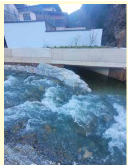
Valserbach nach der Verbauung

Die Gesamtkosten der Verbauungsmaßnahmen am Valserbach betragen € 2,3 Mio. und werden vom Bund, dem Land Tirol und der Marktgemeinde Steinach getragen.