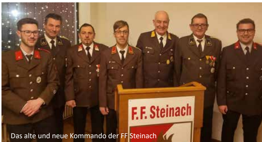
Das alte und neue Kommando der FF Steinach

Den Posten des Kommandanten besetzt nun der ehemalige