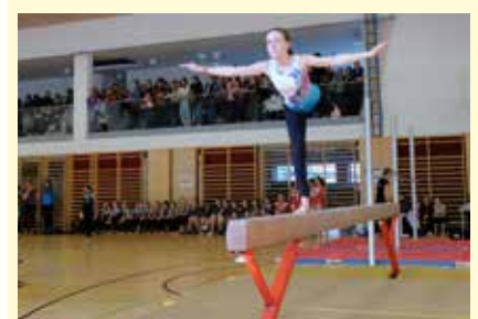
Eleganz am Balken