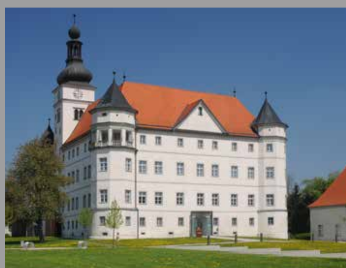
Lern- und Gedenkstätte Schloss Hartheim. Von 1940-1944 eine von sechs Euthanasieanstalten des NS-Regimes, in der nahezu 30.000 Menschen ermordet wurden)