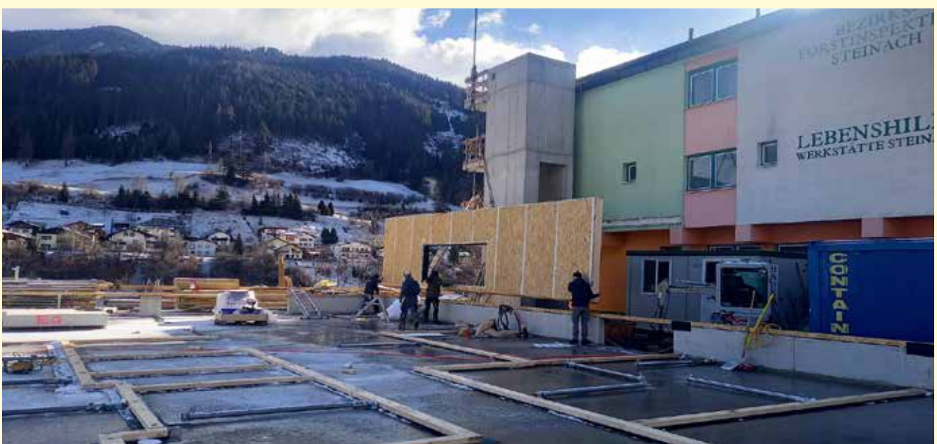
Die Firma Holzbau Schafferer errichtet aktuell das neue Eltern- Kind- Zentrum Wipptal in der Nösslacherstraße 7