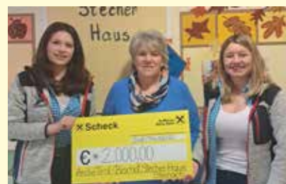
Spendenübergabe an das Bischof Stecher Haus (Arche)