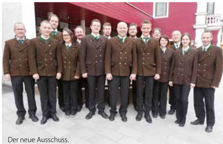
Der neue Ausschuss.