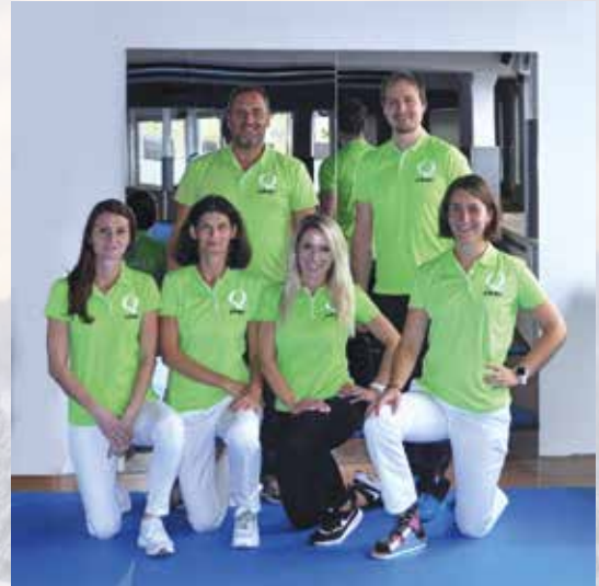
Das Q-loungefit Steinach Team