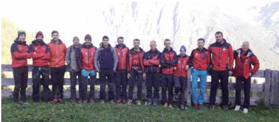
Gruppenfoto während einer Übung auf der Trunahütte.

B ereits das dritte Jahr in Folge sind bei der Leitstelle Tirol mehr als 20 Notrufe von Verletzten oder in Bergnot geratenen Personen im Einsatzgebiet rund um Steinach, Trins und Gschnitz eingegangen. Da eine Bergung mittels Hubschrauber oftmals nicht möglich oder sinnvoll war, musste die Bergrettung heuer zu insgesamt 11 Einsätzen ausrücken. Der Großteil der Alarmierungen wurde wie bereits in den vergangenen Jahren in den Monaten Juli bis September verzeichnet. Besonders schwierig gestaltete sich die Bergung zweier verstiegener Wanderer im Bereich der Äußersten Wetterspitze im hinteren Gschnitztal. Die Personen konnten sich aufgrund des Schneefalls und der Dämmerung nicht mehr orientieren und setzten gegen 20 Uhr den Notruf ab. Nach einer mehrstündigen Bergeaktion, bei teils einem halben Meter Neuschnee und Temperaturen um den Gefrierbereich im Einsatzgebiet, konnten die Personen gegen 4 Uhr früh sicher zur Bremerhütte gebracht werden.