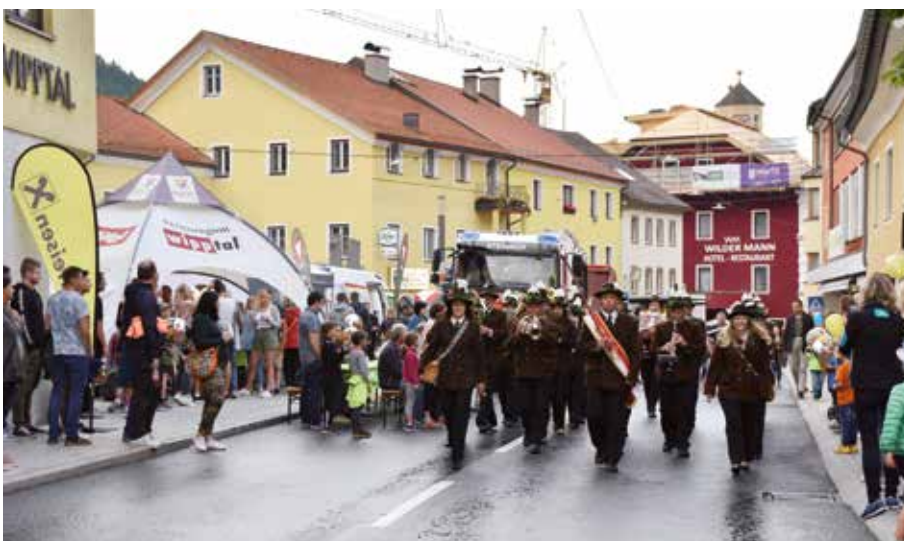
Einmarsch der Musikkapelle Steinach.