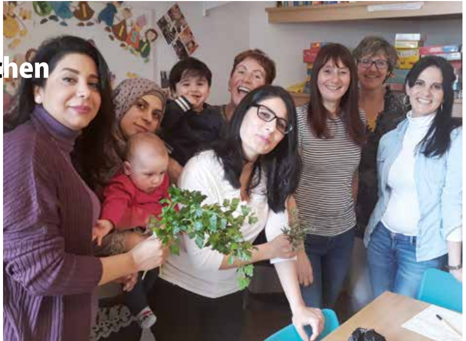
Begegnung verschiedener Kulturen.

Jeden Dienstag nehmen sich die Organisatorin und das Team der ehrenamtlichen Einrichtung „Miteinander“ Zeit für die Bewohner der Arche Steinach, des Seniorenheimes u.v.m.. Viele Freiwillige setzen sich ein für Senioren, Menschen mit Behinderung und Familien in Not und helfen bei Besorgungen - einkaufen, spazieren, zum Arzt begleiten u.v.m.