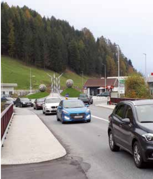
Stau bis zum Kreisverkehr

A ufgrund der katastrophalen Verkehrsentwicklungen und des damit verbundenen Ausweichverkehrs im Wipptal, wird nun eine große Studie in Zusammenarbeit zwischen den Wipptaler Gemeinden, dem Land Tirol, der ASFINAG und der ÖBB für alle Verkehrswege ausgearbeitet.