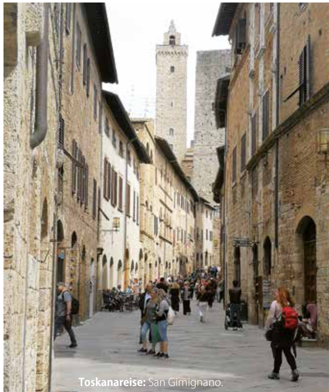
Toskanareise: San Gimignano.

Unser Ausflugsprogramm startete Ende April mit einem Ausflug zum Gardasee. Ende Mai durften unsere Mitglieder eine 5-Tagesreise in die Toskana genießen - mit Tagesausflügen nach San Gimignano, Pisa und einer Rundfahrt auf der Insel Elba. Im Juni fuhren wir vor der Sommerpause noch zum Hintersteinersee. Mit dem traditionellen Törggelen im Oktober und dem Adventausflug endet unsere Ausflugssaison. Auch die quartalsmäßigen Geburtstagsfeiern im Seni-