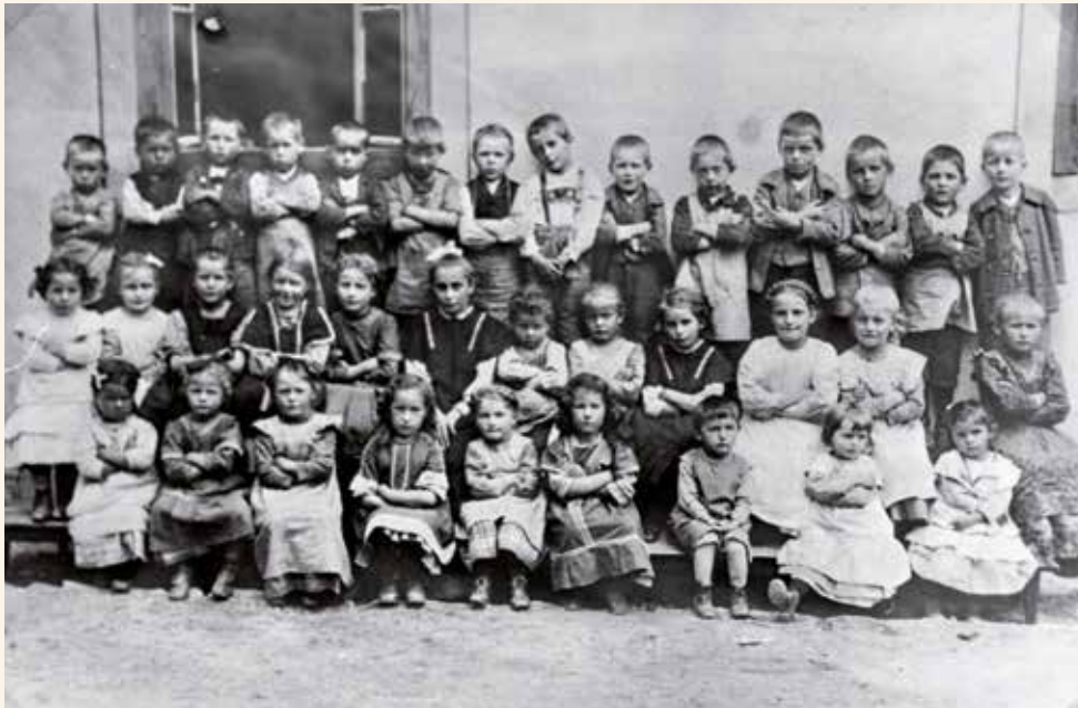
Kinderbewahranstalt in der Plongasse: Laut dem Foto von 1912 besuchten 35 Kinder der Jahrgänge 1906 bis 1909 den damaligen „Kindergarten“.