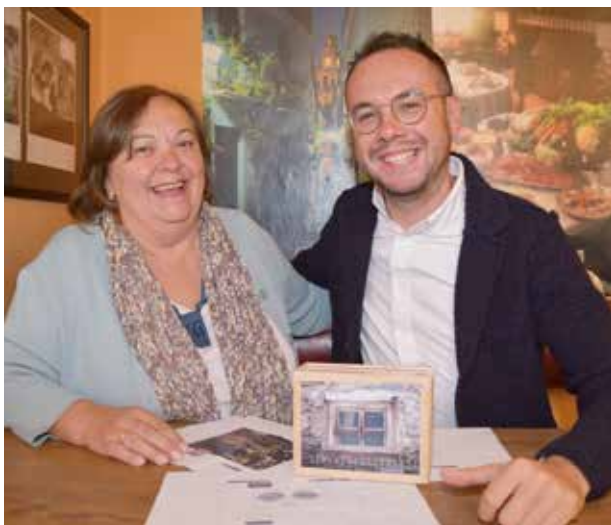
Die Genussspechte mit dem Kochkistl.

D as zweite Kochbuch der Wipptaler Genussspechte ist eigentlich ein Kochkistl voll mit Kreativem – natürlich gefüllt mit erlesenen Rezepten.