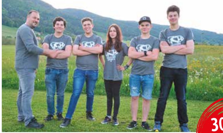
Ausgezeichneter Lehrbetrieb – erstmals mit weiblicher Beteiligung