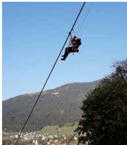
Liftbergeübung auf der Bergeralm in Steinach