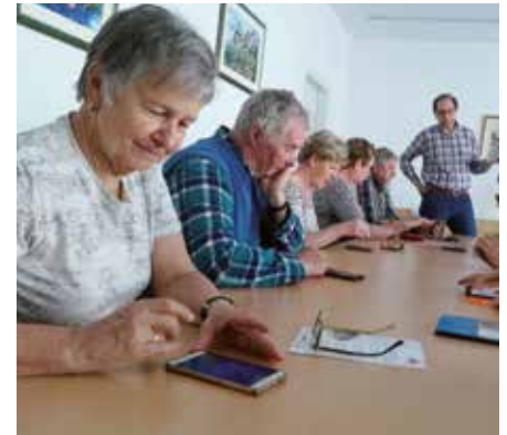
Senioren beim Üben mit dem Handy

Neben den bereits laufenden Computerkursen hat die Computeria Wipptal Ende Oktober ein neues Projekt gestartet. Wer die vielen Möglichkeiten eines Smartphones besser nutzen möchte, kann dies nun in der Computeria erlernen. Dabei wird schrittweise Grundlagenwissen zu den wichtigsten Anwendungen vermittelt. Das Gelernte wird in praktischen Übungen vertieft. So lernen Einsteiger etwa, wie man WhatsApp nutzt, wie man sich im Internet sicher bewegt, wie man gezielt Informationen sucht, wie man eine App installiert, Fotos macht und vieles mehr.