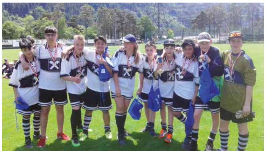
Fußballturnier der Tiroler Sonderschulen: Schülerinnen und Schüler der ASO Wipptal nach dem Gruppensieg beim Turnier im Juni 2019 in Haiming.

Auf der Homepage: www.aso-wipptal.tsn.at