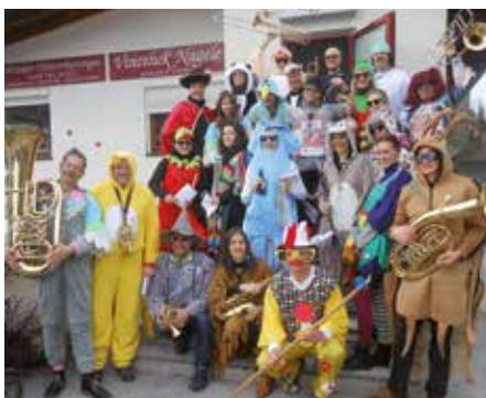
MK Steinach heiter im Fasching.

besser, Jahrzehnte! - gekommenen und teilweise unansehnlich gewordenen Bekleidung zu entwickeln. Dies ging nur mit der großzügigen Unterstützungszusage durch die Gemeinde Steinach, bei der sich die Bundesmusikkapelle Steinach auch auf diesem Wege nochmals herzlich bedanken möchte.