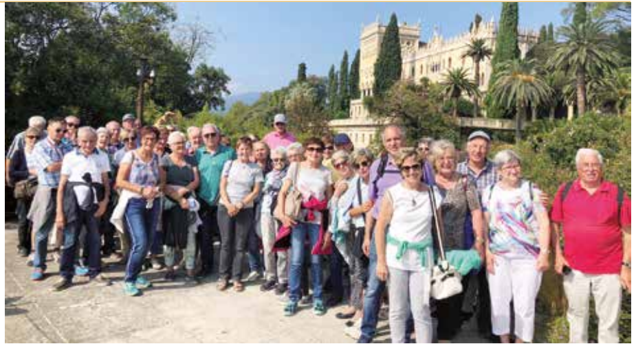
Gardaseereise – Isola del Garda.

Ein gut durchdachtes, interessantes Jahresprogramm für das kommende Jahr ist bereits in Ausarbeitung. Bei der Einhebung des Mitgliedsbeitrages Anfang Jänner wird die Programmübersicht an die Mitglieder übergeben. Jeden letzten Freitag im Monat werden die traditionellen Monatsgeburtstage gefeiert, zu welchen unsere SeniorenInnen im betreffenden