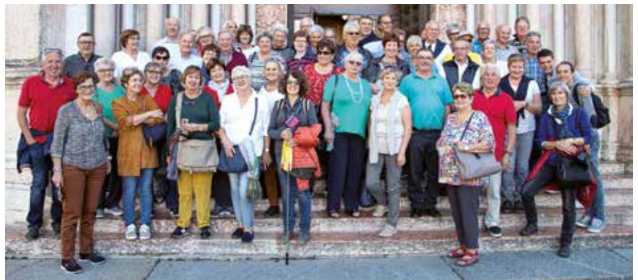
Teilnehmer der 2-Tagesfahrt nach Parma.