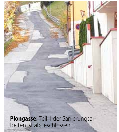
Plongasse: Teil 1 der Sanierungsarbeiten ist abgeschlossen

Da das große Becken im nördlichen Teil des Freischwimmbades nach 45 Jahren an das Ende seiner „Lebenszeit“ gekommen ist und aus verschiedenen Gründen nicht mehr saniert werden kann, ist der Neubau eines Edelstahlbeckens unumgänglich. Gleichzeitig soll dabei auch die gesamte Technik für die Wasseraufberei-