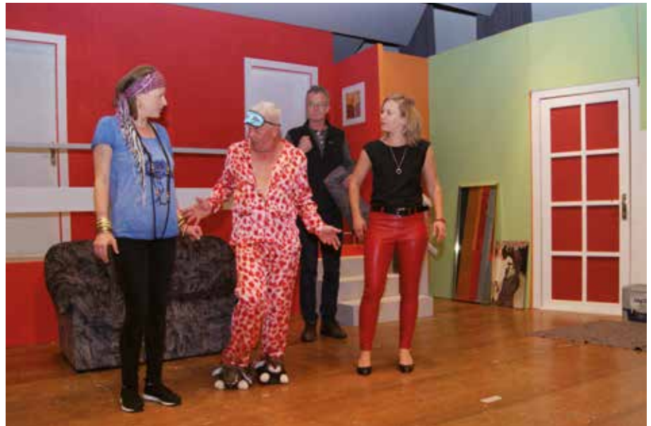
Silvestervorstellung 2019: Die Chaoskomödie „Reset - Alles auf Anfang“.

Ein weiteres Highlight des diesjährigen Vereinsjahres war der zweitägige Theaterausflug, der uns im September an den malerischen Gardasee führte. Ein Dank