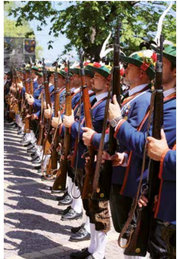
Bilder von links nach rechts: Dankesworte unseres Pfarrers. Unser Pfarrer, ein geschickter Handwerker. Der Bürgermeister gratuliert dem Jubilar. Ehrensalue der Schützenkompanie.