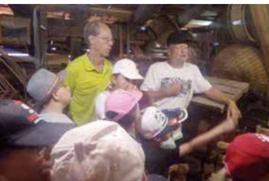
Kaiser Max 500: Auf der Jagd in Schmirn.

G emeinsam konnten wieder zahlreiche Workshops erlebt werden – Sportliches, Kreatives, Naturerlebnisse – und vieles mehr bereicherte wieder den Sommer für viele Familien mit Kindern zwischen 3 bis 14 Jahre.