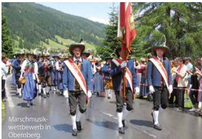
Marschmusikwettbewerb in Oberberg.