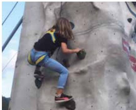
Der Kletterturm: Eine besondere Attraktion für die Kinder.

Der Tourismusverband Wipptal bedankt sich nochmals bei allen Mitwirkenden und lädt alle Interessierten zur Mitarbeit für eine weitere Auflage im kommenden Jahr ein.