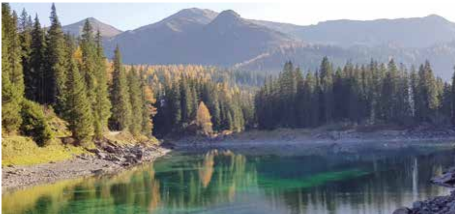
Obernberger See: Ein besonderes Naturjuwel.

D ie Bergwächter der Einsatzstelle Steinach und Umgebung möchten die Gelegenheit nützen und sich kurz im „Steinach aktuell“ vorstellen.